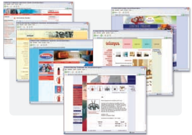
► Viele unserer Kunden nutzen bereits jetzt die Vorteile der LYNET SHOP.Engine

Unsere Systeme sind dort in ihrem Element, wo Standard-systeme scheitern. Dabei können wir schon mittlere Projekte meist erheblich günstiger realisieren als dies mit Standard-systemen möglich wäre. Die Berücksichtigung internationaler Standards wie Zugriff auf SQL-Datenbanken oder der Datenaustausch via XML sind selbstverständlich.