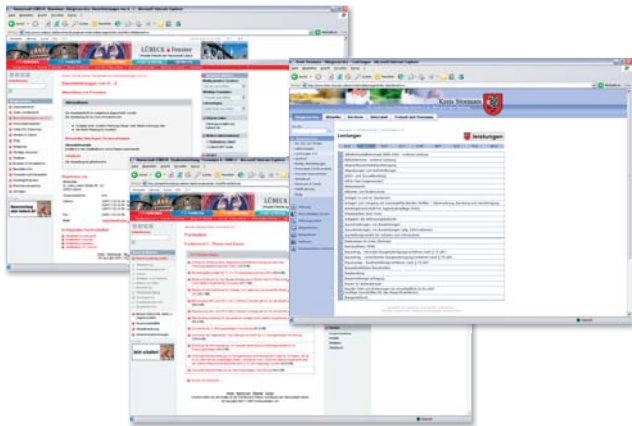
► Kundenorientiertes Lebenslagenmodell

Ab sofort bietet Ihr Internet-Auftritt noch mehr Bürgernähe: Das vollständig neu implementierte Bürgerservice-System LYNET eGov BS 2.0 ermöglicht datenbankbasiert die nahtlose Integration aller für die Geschäftsvorfälle zwischen Bürger und Behörde notwendigen Informationen und Services.