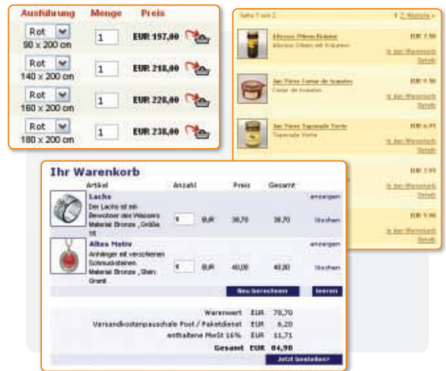
► Übersichtliche Warenkorbgestaltung, Listenansicht und Variantenauswahl

Nur durch eine wirkliche Integration in Prozesse und Systeme lassen sich die heute erforderlichen Wettbewerbsvorteile realisieren. Entsprechende Beispiele erläutern wir Ihnen gerne persönlich.